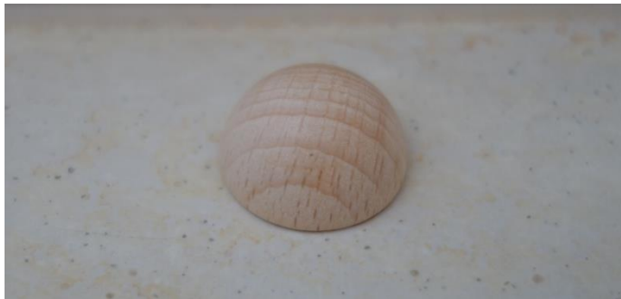
Halbkugel aus Holz

Die Raumentstörung besteht aus vier Halbkugeln aus Holz, welche auf dem Boden plaziert werden.